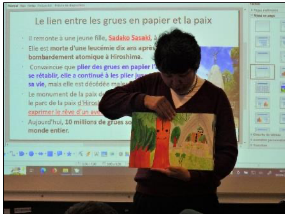
Kamishibai de la Paix