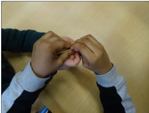
Kamishibai d'histoires sur la Paix après le bombardement nucléaire à Hiroshima et pliage des grues