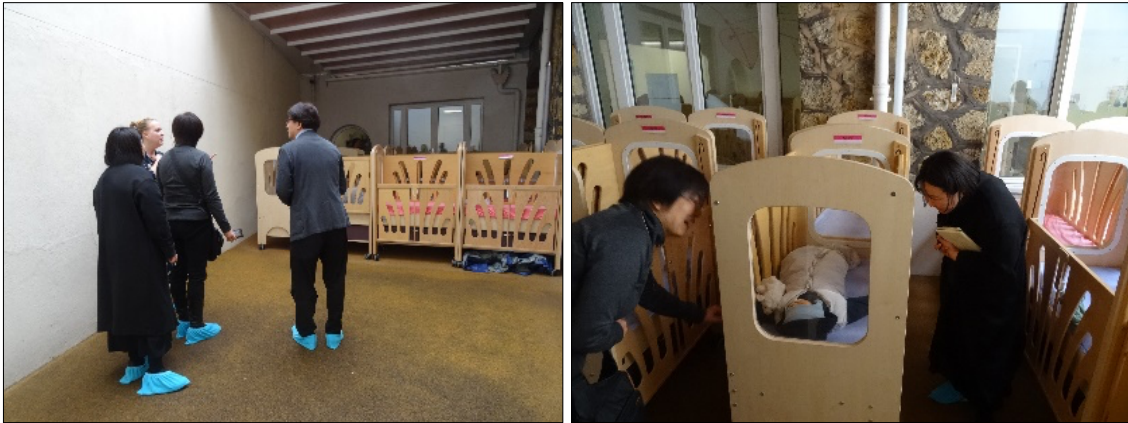
Le dortoir extérieur sur la terrasse aménagée