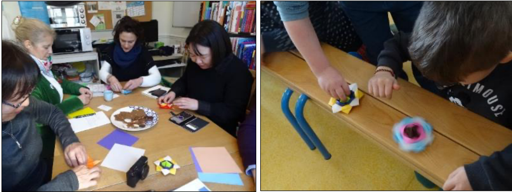
Fabrication d'une toupie en origami