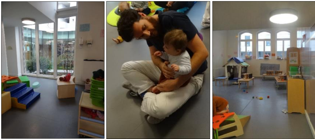
Les espaces de vie