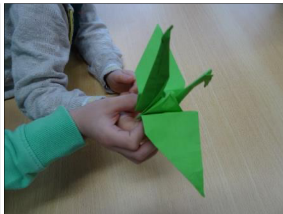
Création dans la joie et la coopération !