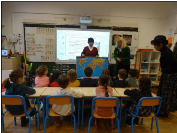
Repérage géographique du Japon