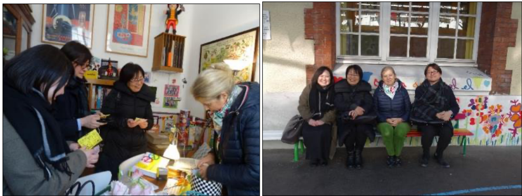
Fabrication de mini-livres et rencontre sur le « Banc de l'amitié » de la cour de récréation

Nous avons aussi échangé avec les enseignantes de cycle 2 d'une école élémentaire du groupe scolaire : peut-être de futurs projets inter-cycles en perspective !