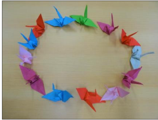
Classe de Grande Section