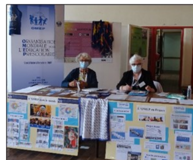
Le stand OMEP

Ce congrès, festif et pertinent, a permis de présenter l'OMEP dans sa dimension internationale et de proposer la mutualisation de nos compétences avec celles de l'AGEEM